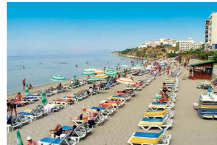
Øverst: Efesos. Venstre: Bystranden i Kusadasi. Højre: Fugleøen.

Der er mange gode restauranter i Kusadasi, specielt i den gamle by. Besøg for eksempel Restaurant Erzincan, en af Kusadasis flere charmerende, små tyrkiske restauranter. Ved marinaen er der masser af gode restauranter, mange af dem med fantastiske fiske- og skaldyrretter. Den såkaldte Bar Street i den gamle by er berømt for sit livlige natteliv. Her er der flere diskoteker, som har åbent til langt ud på natten. I marinaen bliver der ofte spillet live musik på flere af restauranterne og barene.