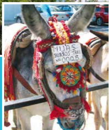
Øverst: Malaga Venstre: Æseltaxi i Mijas Nederst: Gibraltar

Årets store nyhed er at vi også har fået All Inclusive-rejser til skønne Costa del Sol. At tage til Spaniens solkyst indebærer at se smukke landskaber, smage udsøgt mad og at træffe den imødekommende befolkning. Du kan også gå på opdagelse i en rig kulturarv, prøve fantastiske strande og opdage charmerende landområder.