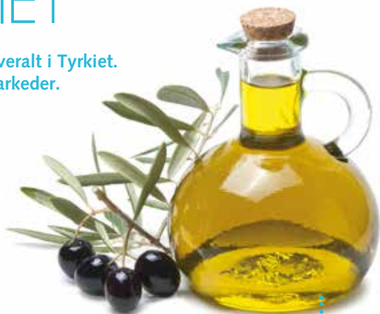
Olivenerolie af høj kvalitet fås bl.a. på de lokale markeder.