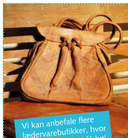
Vi kan anbefale flere lædervarebutikker, hvor du er sikker på at få høj kvalitet til en god pris.

I Tyrkiet får du lav pris og hurtig betjening, når du handler briller, solbriller og kontaktlinser.