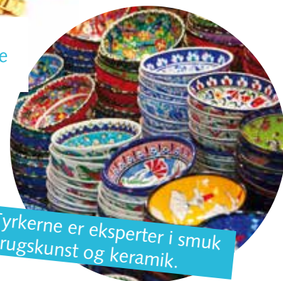
Tyrkerne er eksperter i smuk brugskunst og keramik.

Prisen på smykker er ofte meget lav i Tyrkiet, fordi de er billigere at fremstille.