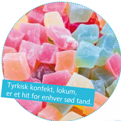
Tyrkisk konfekt, lokum, er et hit for enhver sød tand.

Her har vi samlet et udvalg af de bedste souvenirs, som du finder overalt i Tyrkiet. Kontakt din guide for at høre nærmere om de bedste butikker og markeder.